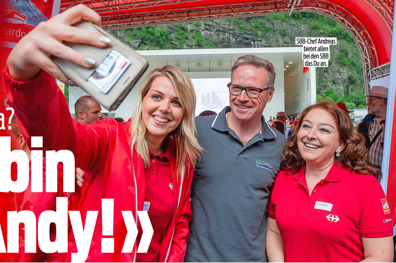
SBB-Chief Andreas bietet allen bei den SBB das Du an.